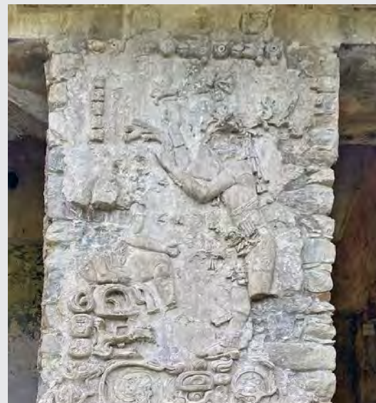
Templo XIII (Reina Roja)