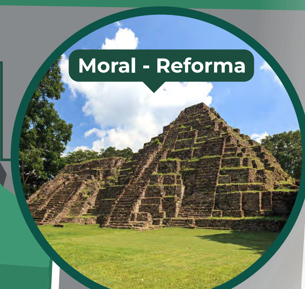
Moral - Reforma